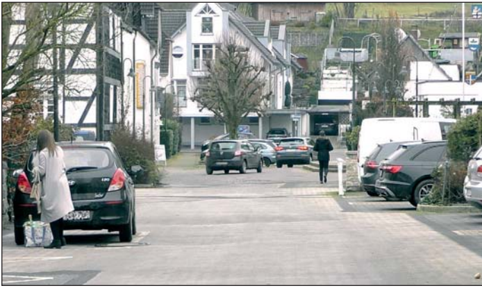
Bereits vor sieben Jahren wurde die Umgestaltung der Hoffmeisterstraße beschlossen, in 2021 soll sie nun erfolgen.