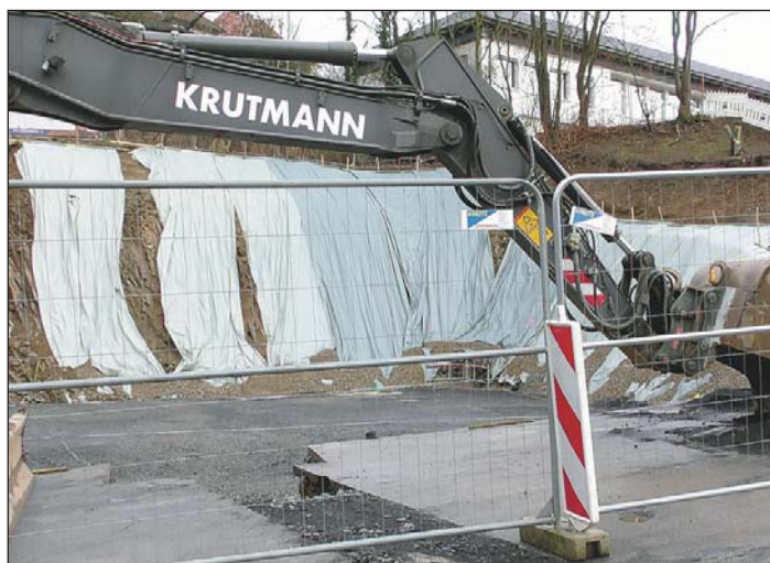
Nach der Bodenplatte dürfte es erst einmal eine Winterpause geben.