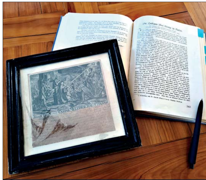
Die Drei-Könige-Urkunde und das Heimatbuch.

Der über 500 kg schwere Schrein aus dem 12. Jahrhundert ist nicht nur an sich von einem immensen weltlichen Wert und ein herausragendes Zeugnis mittelalterlicher Goldschmiedekunst, auch auf geistlicher Ebene hat das zwei Meter lange, 1,53 Meter hohe und 1,10 Meter breite Kunstwerk einiges zu bieten: In eine Lade gebettet enthält er unter anderem Gebeine, die 1164 vom Erzbischof Reinald von Dassel nach Köln gebracht