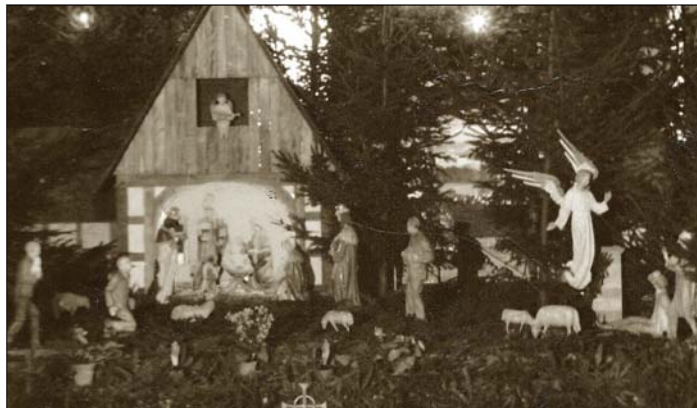
In den 1950er Jahren entstand dieses Bild der Krippe. Damals stand sie noch in der alten Kirche.