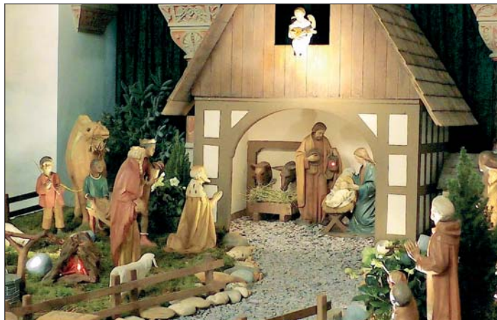
Dieses Bild entstand im vergangenen Jahr. Die Hl. Drei Könige kommen nämlich erst am 6. Januar dazu.

Die menschlichen Züge der Figuren waren sogar so menschlich geworden, dass man zwei Personen gut erkennen konnte. Der Balver