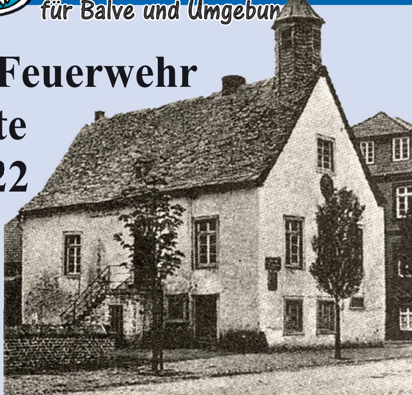
Das alte Rathaus war gleichzeitig Feuerwehrhaus. Dort lagerten im Keller die Löschutensilien, hauptsächlich Ledereimer, um Wasser zur Brandstelle zu bekommen.

Zu Zeiten der großen Stadtbrände war das noch anders. Da gab es zwar auch Feuerschutz, doch war das wenig organisiert. In Balve standen, etwa zum Zeitpunkt des letzten großen Stadtbrandes im Jahr 1789, Löschgeräte im Rathaus, dem heutigen Volksbank-Gebäude. In Nachbarschaftshilfe wurde der Brand bekämpft, oft aus Eigennutz, um das eige-