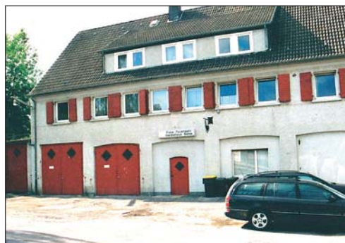
Kostengründe waren dafür ausschlaggebend, dass das alte Feuerwehrgerätehaus, wie es noch viele kennen, umgebaut wurde.

Quellen: Festschrift 50 Jahre Feuerwehr Balve – Festschrift 75 Jahre Feuerwehr Balve von Günter Cordes – Feuer und Feuerschutz im kurkölnischen Sauerland.