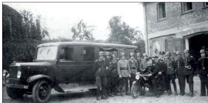
Das alte Krefelder Polizeiauto wurde zum ersten Balver Feuerwehrfahrzeug umgebaut. Im Hintergrund der Rohbau des Feuerwehrgerätehauses an der Hofstraße.

Weltkrieges kam es durch Artilleriebeschuss, der sich beim Widerstand deutscher Soldaten gegen amerikanische entwickelte, immer wieder zu Bränden im Stadtgebiet. Trotz dieser gefährlichen Situation löschten die Feuerwehrkameraden wo sie konnten und hielten damit den Schaden im Stadtgebiet klein.