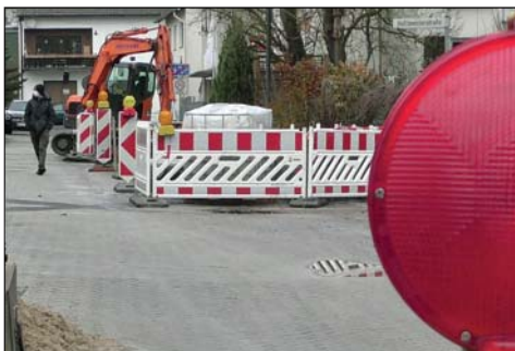
Die Arbeiten an der Hoffmeisterstraße haben begonnen und werden bis zum Sommer andauern.

Die Stadt Balve bittet alle Betroffenen um Verständnis. Rückfragen: Bauamt der Stadt Balve, Telefon 02375 / 926 146.