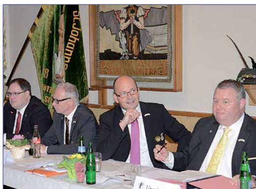
Auf Vorschlag des Vorstandes stimmten die Schützenbrüder aus Balve für die Erhöhung des Mitgliedbeitrags.

die 400 beitragsfreien Mitglieder per Abstimmung dazu zwingen, ab sofort wieder Beiträge zu entrichten, und zwar in Höhe von 12 Euro. Der Antrag wurde jedoch mit großer Mehr-