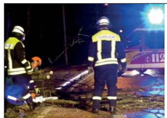
Für die Löschgruppe Balve fiel der Startschuss für die Einsätze mitten in der Nacht.

Darauf folgte Orkan „Ylenia“. Mit Windgeschwindigkeiten von mehr als 100 Stundenkilometern peitschte