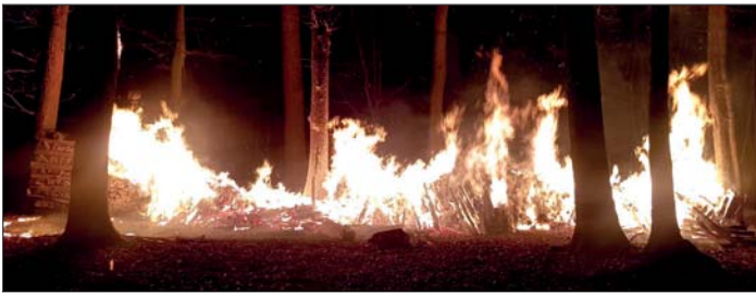
Die Holzstapel brannten bei Eintreffen der Feuerwehr in hellen Flammen. Das Ablöschen dauerte einige Zeit.