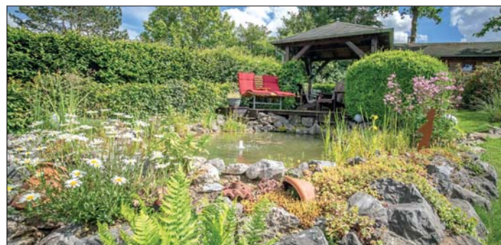
Schöne Gartenanlagen inspirieren die Besucher für den eigenen Garten.

Die Stadt Balve würde sich über viele neue teilnehmende Gärten in diesem Jahr freuen.