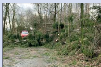
Zahlreiche Bäume, wie hier auf dem Weg nach Klingelnborn, warf Zeynep um.