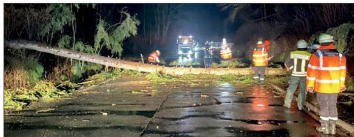
Das Hönnetal und das ehemalige Unteramt waren besonders von den Sturmfolgen betroffen.