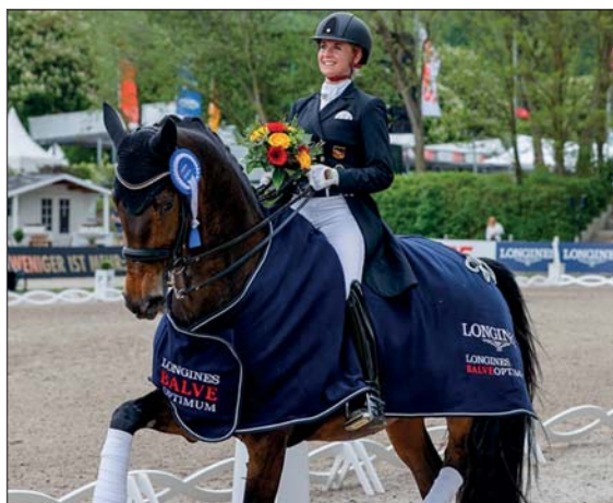
Alle Jahre wieder ist die Weltelite der Dressurreiter in Wocklum, wie hier Jessica von Bredow-Werndl im vergangenen Jahr, die kurz darauf Olympiasiegerin wurde.

pekte für den Reitsport in der Pandemiezeit?