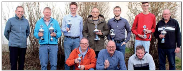
Gut Wurf: Die Sieger und Geehrten.