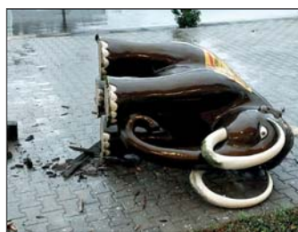
Auch der dickste Mammut konnte der Orkanserie nicht standhalten.

Vorausgesagt waren für den Orkan „Zeynep“, der nur wenige Stunden später Balve erreichte, noch höhere Windgeschwindigkeiten. Im Balver Feuerwehrgerätehaus wurde nachmittags, zum Glück ein Freitag, der Meldekopf eingerichtet. Die Kreisleitstelle leitete die Einsätze aus Balve sofort weiter und hier vor Ort wur-