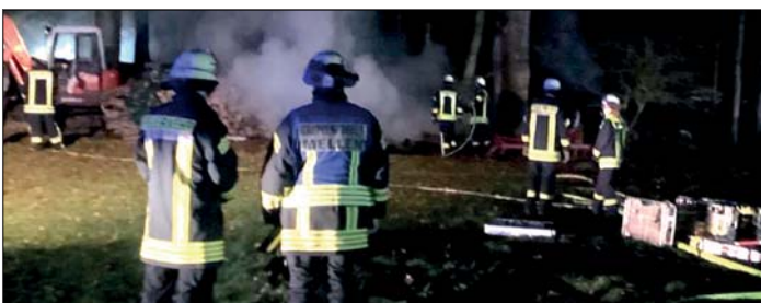
Mit einem kleinen Bagger wurden die Holzscheite auseinander gezogen und abgelöscht.

Nicht untätig blieb unterdessen die Polizei, die kurz nach dem Entdecken der Brände einen Balver in der Nähe antraf. Er wurde vorläufig festgenommen. Die Polizei sicherte Spuren und durchsuchte anschließend die Wohnung des mutmaßlichen Täters. Die Ermittlungen wegen Sachbeschädigung durch Feuer laufen, heißt es weiter aus der Pressestelle der Polizei. kr