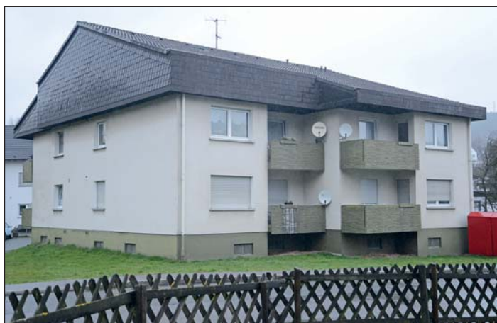
In dieses Haus ziehen 25 Flüchtlinge ein.