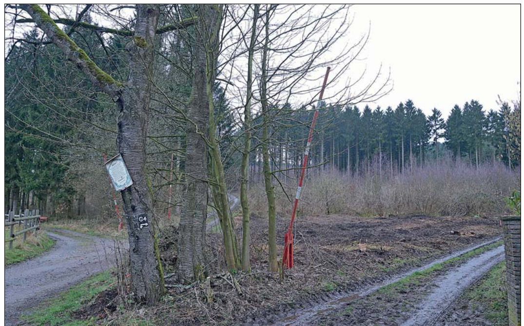
Diese beiden Vogelkirschen sorgen seit Wochen für einen erbitterten Streit.