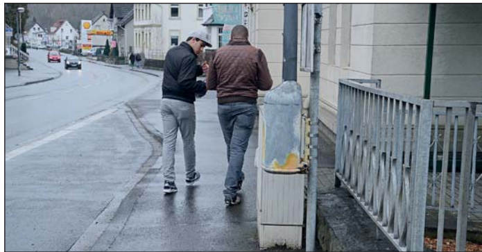
An dieser Stelle beleidigte die Radfahlerin die blinde Frau aus Balve.

Daraufhin habe die aufgebrachte Radfahlerin mit einem hämischen „Blablabla“ reagiert. „Das hat mich so betroffen gemacht, dass ich geweint habe“, erzählt uns die Hönnestädterin, die die Radfahlerin auf Grund ihrer Stimme als eine Frau mittleren Alters deklariert.