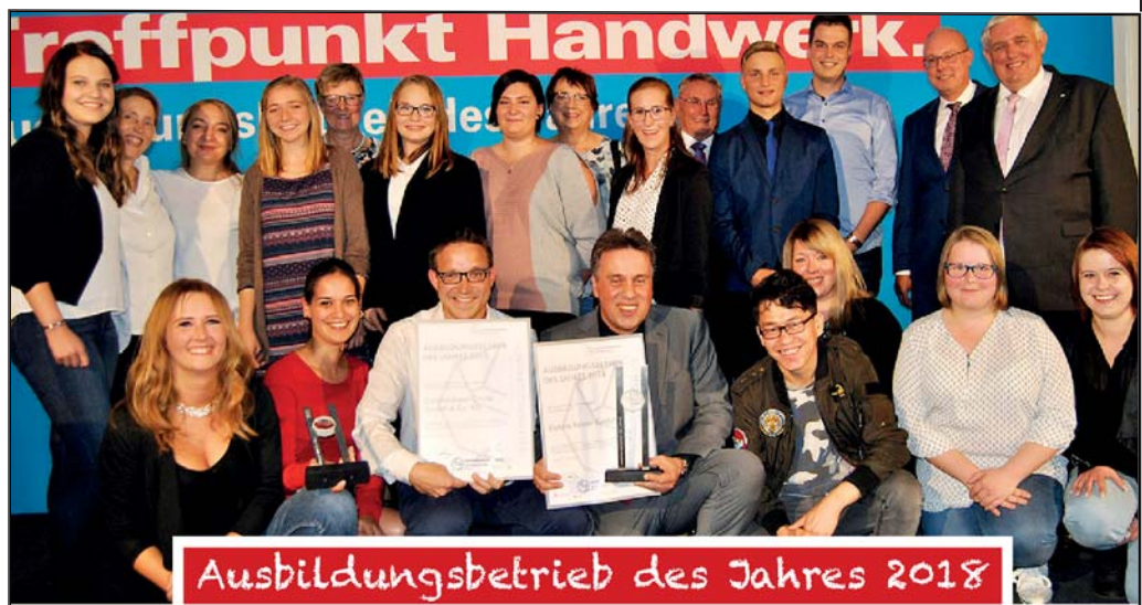
Ausbildungsbetrieb des Jahres 2018

Werde Teil des Teams und mache eine Ausbildung bei der Goldbäckerei!