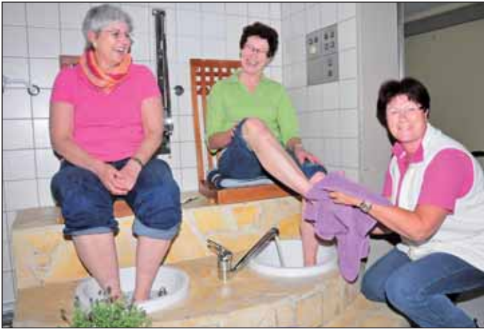
Beim Tag der offenen Tür des Gesundheitscampus stellt der Kneipp-Verein seine neue Abteilung vor.

Der Kneipp-Verein erweitert sein Gesundheitsangebot in Balve. Im Erdgeschoss des Gesundheitscampus haben die Mitglieder des Vereins die neue Kneippische Gussabteilung eingerichtet.