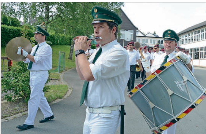
Seit 60 Jahren in L.A.: Trommlerkorps Küntrop.

Zur Einstimmung auf das Fest und um die Vorfreude zu steigern, sei allen Interessierten ein Blick auf die neu gestaltete Internetseite www.schuetzen-la.de empfohlen.