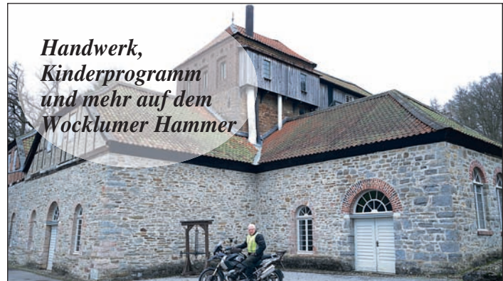
Handwerk, Kinderprogramm und mehr auf dem Wocklumer Hammer

P assend zum Muttertag startet die Luisenhütte in Wocklum am Sonntag, 8. Mai, mit einem Museumsfest für die ganze Familie in die neue Saison. Von 11 bis 18 Uhr dürfen sich die Besucher auf ein abwechslungsreiches Programm mit freiem Eintritt freuen. Zudem können sie die neue Mitarbeiterin des Museums für Vor- und Frühgeschichte, Ulrike Knips, kennenlernen.