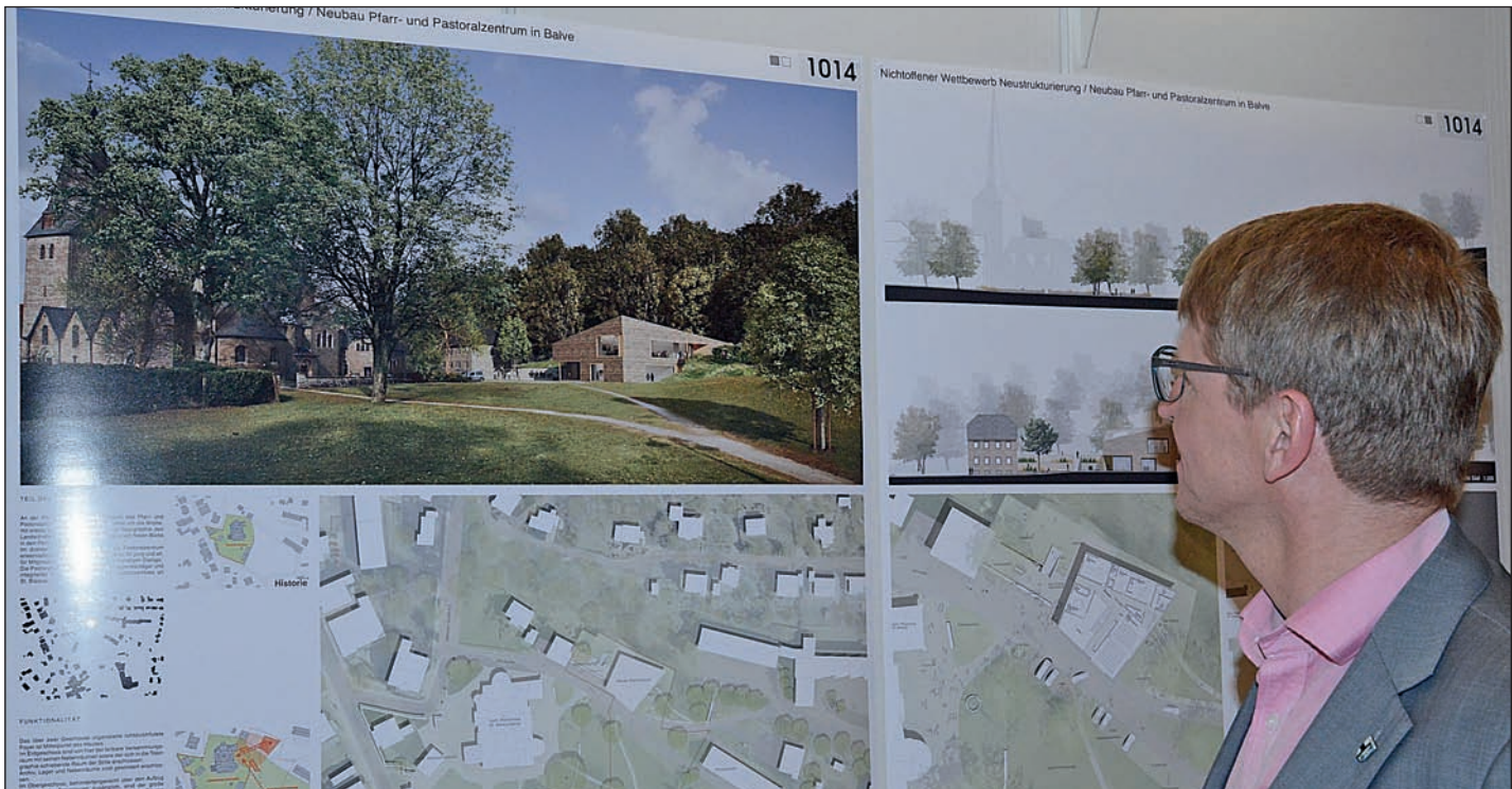
Martin Gruschka (Kirchenvorstand) weiß, dass sich die ursprünglichen Pläne erledigt haben. Jetzt ist ein Neustart geplant, um doch noch ein neues Pfarrzentrum bauen zu können.