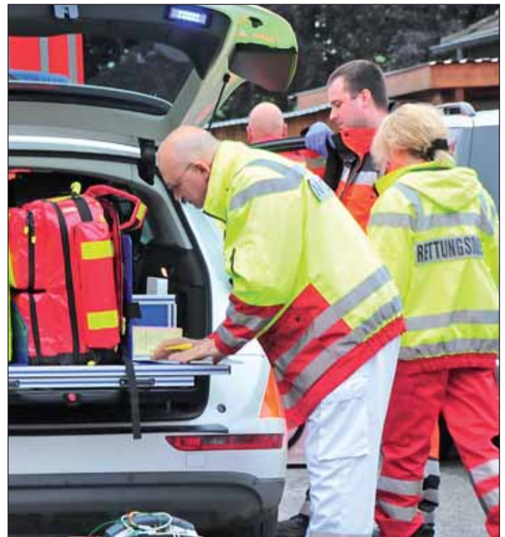
Notarzt und Rettungssanitäter hatten am Vattertag viel Arbeit im Golddorf Mellen.

Die Polizei beginnt noch am späten Nachmittag mit den Ermittlungen. Sie nimmt die Axt an sich und zieht den 68-Jäh-