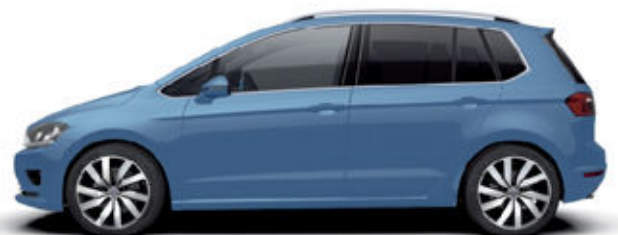
Abbildung zeigt Sonderausstattungen gegen Mehrpreis.