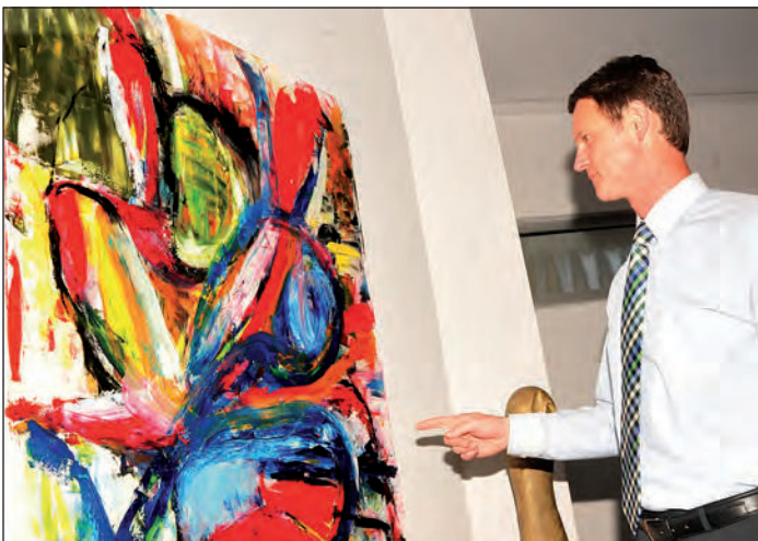
Noch bis Mitte August sind die Bilder im Rathaus zu sehen.

Der Ausschuss „Schule, Kultur, Soziales, Sport“ hat beschlossen, diese Veranstaltung grundsätzlich in der im Jahre 2000 wieder aufgenommenen Form fortzusetzen und als festen Termin jeweils den 2. Dienstag im Dezember festgelegt. Auch die Veranstaltung des vergangenen Jahres, die von Schülerinnen und Schülern, Lehrkräften und Eltern der Städtischen Realschule Balve gestaltet worden ist, hat deutlich gemacht, dass die Adventsfeier für die Senioren bei den älteren Bürgerinnen und Bürgern nach wie vor einen sehr hohen Stellenwert besitzt. Die Vereinigte Sparkasse im Märkischen Kreis hat sich im Wege des Sponsorings, wie bereits in den vergangenen Jahren, wieder bereit erklärt, die durch die Veranstaltung entstehenden Kosten abzudecken.