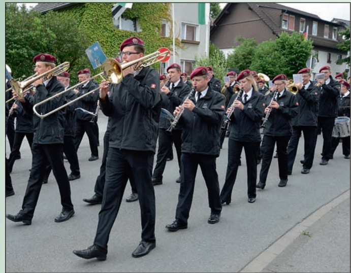
Der Musikverein „Amicitia“ Garbeck ist am Sonntag im Festzug dabei.

All jene, die erst einmal draußen feiern wollen, erwartet auf dem Hallenvorplatz ein Bierstand, ein großer Schirm, so dass nach Meinung des Brudermeis-