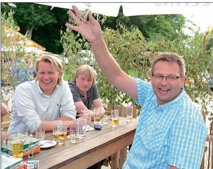
Der Biergarten lädt wieder zum Feiern ein.

Die neuen Majestäten präsentieren sich mit ihrem Hofstaat um 16.45 Uhr im Festzug. Und zum Finale des Schützenfestes 2015 wird um 20 Uhr die befreundete Schützenbruderschaft St. Hubertus Volkringhausen mit ihrem Königspaar und Hofstaat erwartet, um gemeinsam in den letzten Stunden des Festes noch einmal Gas zu geben und für eine gute Stimmung zu sorgen.