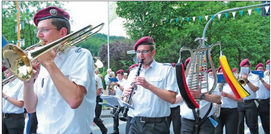
Festmusik in Volkringhausen: Musikverein „Amicitia“ Garbeck.

Zurück in der Hubertushalle ist für 19.30 Uhr die