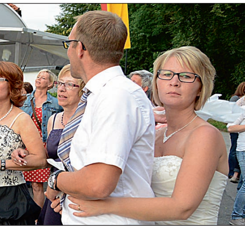
...olle Stimmung auf dem Schützenfest.

men. Um 17 Uhr findet eine Zaubershow statt. Zeitgleich erfolgt die Ehrung der Jubelkönige und -königinnen.