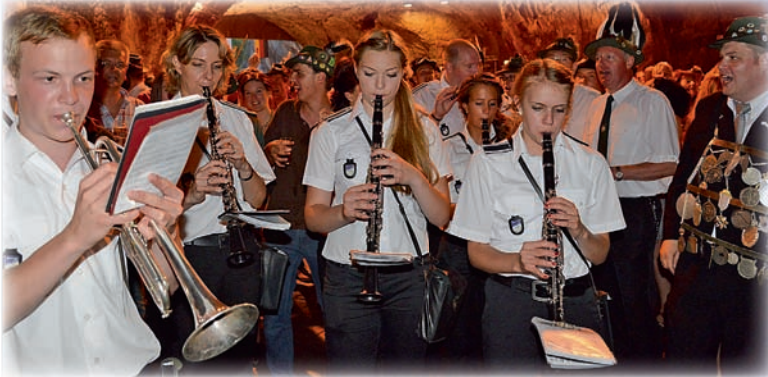
Die Balver freuen sich auf den MV Lichtringhausen.

Messe in der St.-Blasius-Kirche machen. Mit dem Schlusssegen des Pfarrers versehen, wird gemeinsam gefrühstückt und dann ab 9.30 Uhr im Steinbruch der neue König ausgeschossen, der um 13 Uhr in die Stadtmitte kommt.