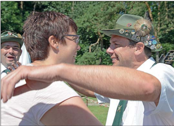
Auch das Königspaar Danne freut sich auf das Jubiläumsschützenfest.