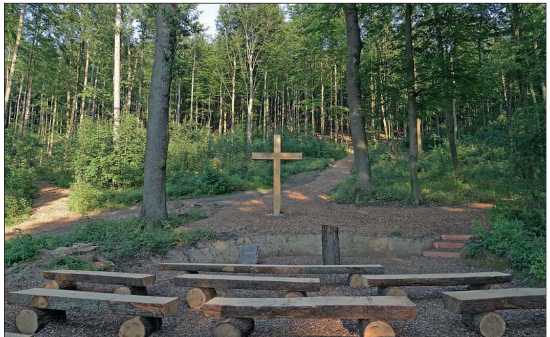
im Trostwald, zu dem die Immobilien GmbH Trostwald Balve Sauerland schon heute alle Interessierten einlädt.

Am Sonntag, 26. August, besteht dann für jedermann die Gelegenheit, sich den Trostwald von den Förstern vorstellen zu lassen. Den Abschluss dieser Informationsveranstaltung bildet um 18 Uhr ein Ökumenischer Gottesdienst auf dem Verabschiedungsplatz