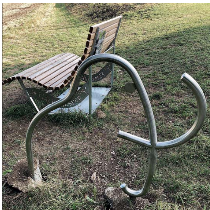
wurde, ist die Sitzbank bereits beschädigt worden. Irrende Unbekannter hat eine Latte abgerissen.

ten Schaden in Augenschein nahm. Er hat keinerlei Verständnis dafür, dass es Zeitgenossen gibt, die mutwillig den nicht unbeträchtlichen Schaden herbei geführt haben, und zwar mit brachialer Gewalt. Denn das einbetonierte „Mammut“ hebt man nicht soeben aus dem Boden. Sollte es Zeugen geben, die die Vandalen beobachtet haben, werden sie gebeten, sich bei der Firma Paul Müller in Garbeck zu melden. Übrigens: Bevor das „Mammut“ aus dem Erdreich gerissen