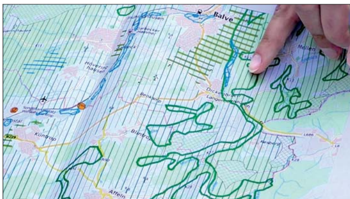
Die Bereiche der Gewässer in der Stadt Balve sollen unter besonderen Schutz gestellt werden, sieht der Regionalplanentwurf vor.

„Wenn der Regionalplan so umgesetzt wird, können wir dicht machen“, zeigte sich Markus Schwartpaul tief betroffen. „Zumindest alle Hofflächen müssen