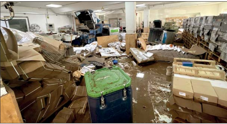
Nach Abfließen des Wassers wurde das ganze Ausmaß des Hochwassers im Drucksaal deutlich.

denfalls fest: neue Maschinen haben mindestens eine sechsmonatige Lieferzeit. So lange will man nicht warten, „dann müssen zunächst gebrauchte her.“