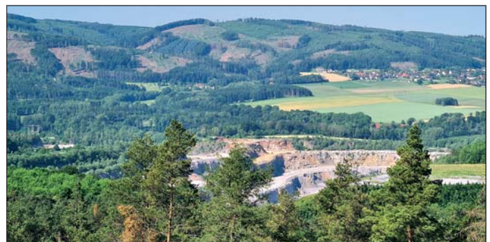
Blick über den Steinbruch zum Balver Wald.

Nach diesem ersten Highlight folgen wir dem aus-