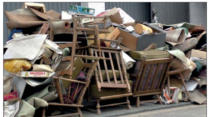
Müllberge an allen betroffenen Straßenzügen.