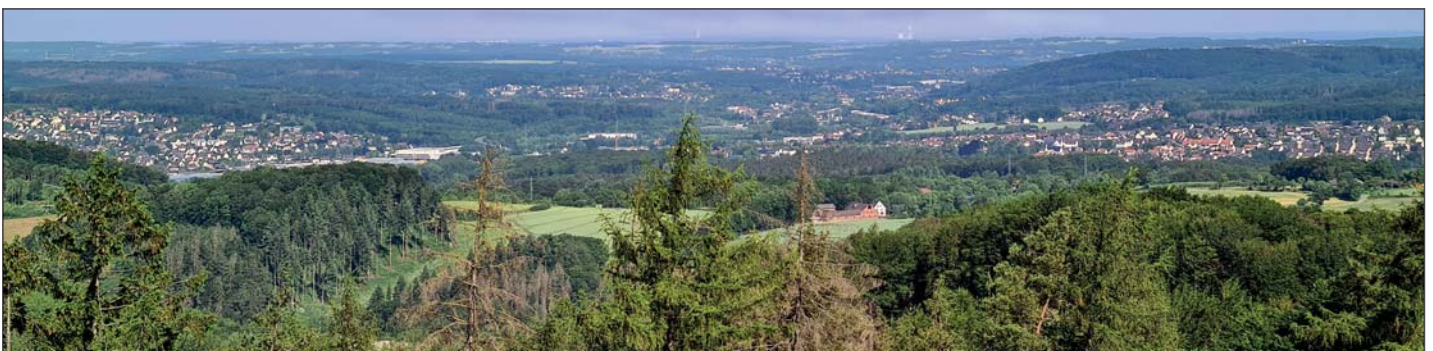
Vom Ebberturm kann man bei schönem Wetter in Richtung Hamm-Uentrop das Kraftwerk im Hintergrund sehen.

Wir erinnern uns: 50 m weiter befinden sich Hotels, die schon bei Beginn unseres Marsches so einladend aussahen und auch sicherlich jetzt noch ein Plätzchen für durstige und hungrige Wanderer frei haben.