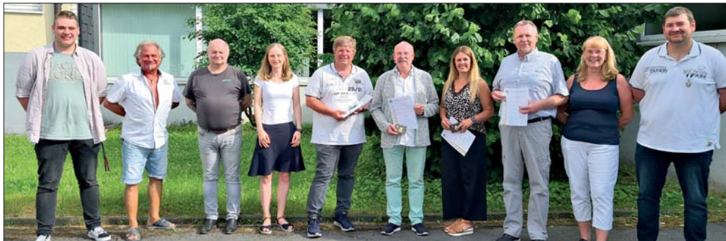
Ehrungen standen auf der Tagesordnung der Schießsportgruppe.