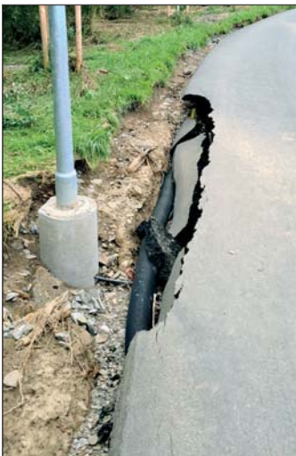
Die Schäden an Straßen, wie hier am neuen Fuß-/Radweg und Brücken hielten sich in Balve in Grenzen.

Schon bald am nächsten Tag nach der Flut kristallisierte sich heraus, dass aufgrund dessen, dass 50 bis 60 Häuser abgesoffen waren „und dabei sprechen wir nicht von denen, die nur den Keller voll hatten“, so Bürgermeister Hubertus Mühlhling, eine Menge Müll anfallen würde. Und da hatte mal wieder die Stadt Balve die Nase vorne, denn frühzeitig wurde die Sperrgutabfuhr für die Straßenzüge beim Zweckverband angemeldet. Andere Städte hatten dann das Nachsehen.