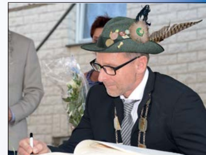
Die Majestäten tragen sich in das Goldene Buch ein.

Krönender Abschluss der Aktionen unter dem „Drostenzelt“ ist das Finale des Balver Stadtfest, das um 19.30 Uhr beginnt. Für tolle Stimmung sorgt am Samstagabend die Partyband „Mammuts“ vom Musikverein Balve. Kurz nach Mitternacht ist das 26. Balver Stadtfest Geschichte, denn dann werden die Zapfhähne hoch gedreht.