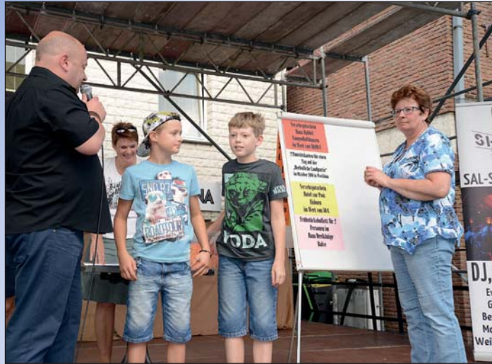
Die Gewinnlose werden am Samstag ab 17.30 Uhr auf der Hauptbühne gezogen.