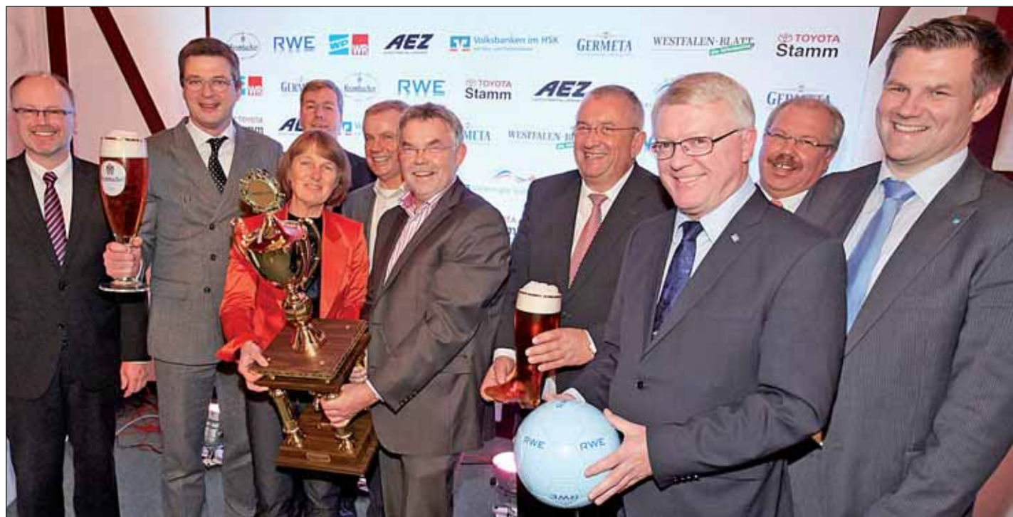
Der Sponsorenkreis des RWE WinterCups 2014 bei der Gruppenauslosung in Langscheid.

Zum Jubiläum rollt der Fußball auch wieder im Schulzentrum „Am Krumpaul“