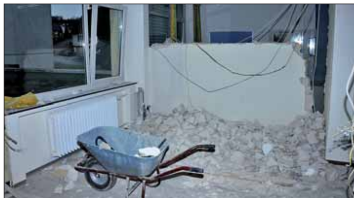
Derzeit laufen die Umbauarbeiten im Gesundheits-Campus Sauerland auf Hochtouren.