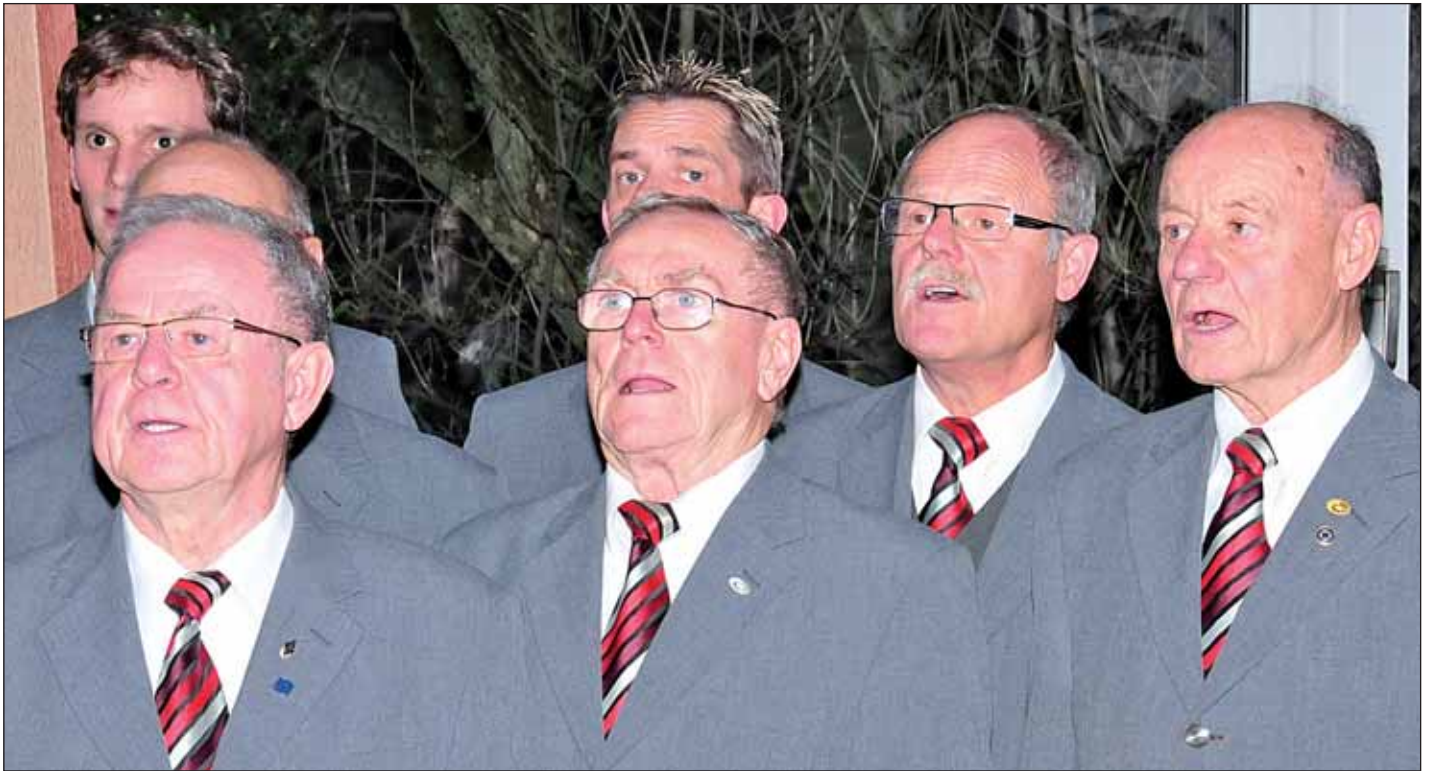
Der Männerchor Balve hat großen Anteil daran, dass die Menschen am 14. Dezember auf Weihnachten eingestimmt werden.