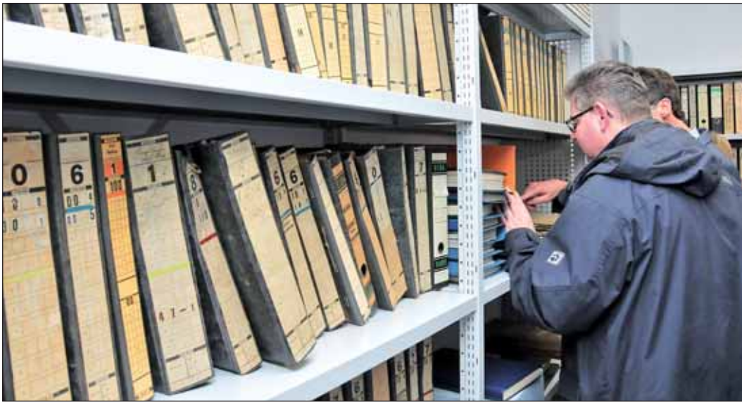
Die Mitglieder des Kulturausschusses nahmen das neue Stadtarchiv in Augenschein.