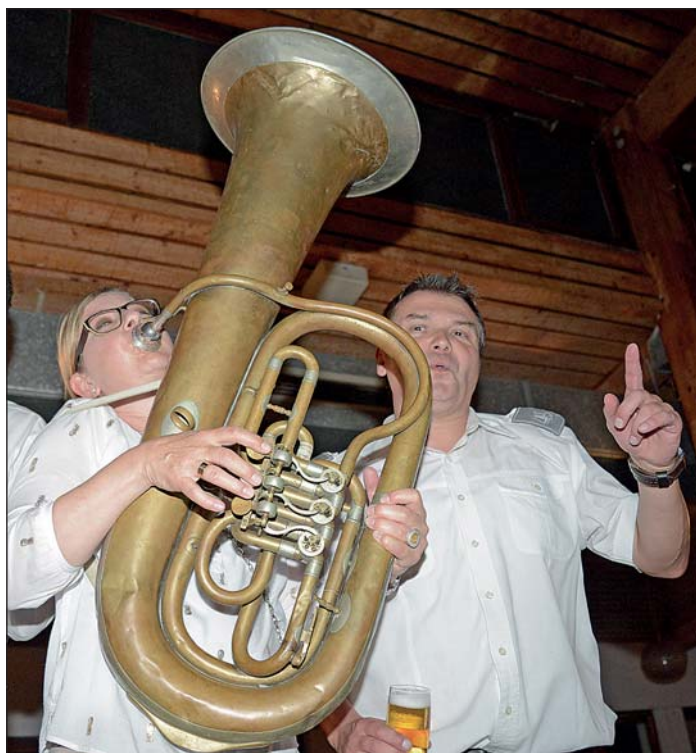
Wer bläst zukünftig die Tuba in Volkringhausen?