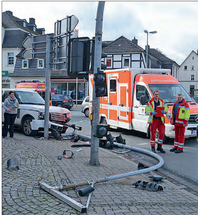
Nach dem Unfall installiert die Firma Siemens einen neuen

pel werden mit wenigstens 15.000 Euro beziffert.