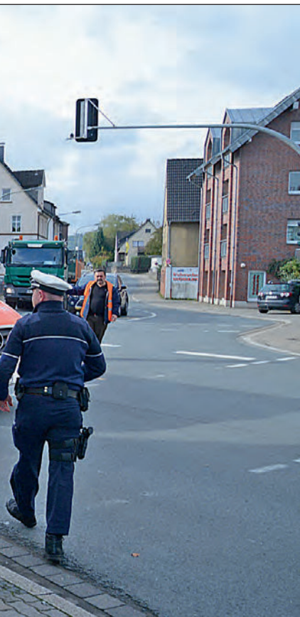
Ampelmasten auf der B 229.

Ampel in Balve ein Behördengespräch geben werde.