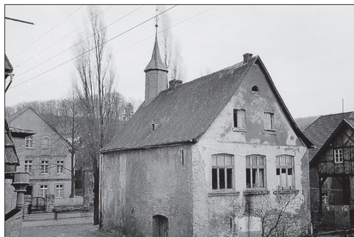
In diesem Gebäude war die Sparkasse untergebracht.

Dabei schöpft er auch diesmal wieder, nach kritischer Auswahl, aus dem Fundus von Gustav Engel. Von etwa 1950 bis 1970 dokumentierte der heimische Fotograf wesentliche kulturelle und sportliche Ereignisse in Stadt und Amt Balve. Ihm