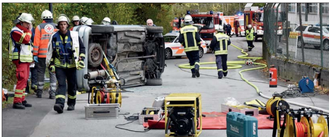
Sofort nach dem Eintreffen der Ersthelfer werden die Verletzten versorgt.