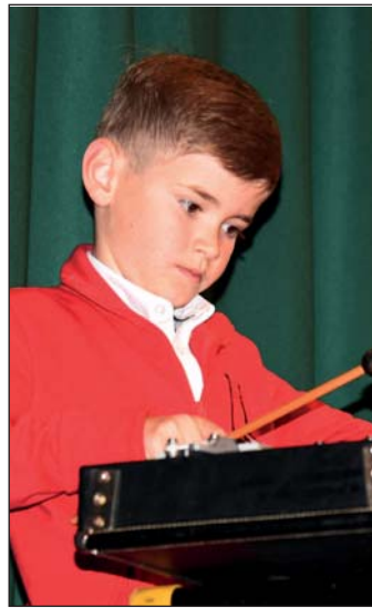
ChorAtelier Garbeck. „Wir freuen uns, dass wir mit der