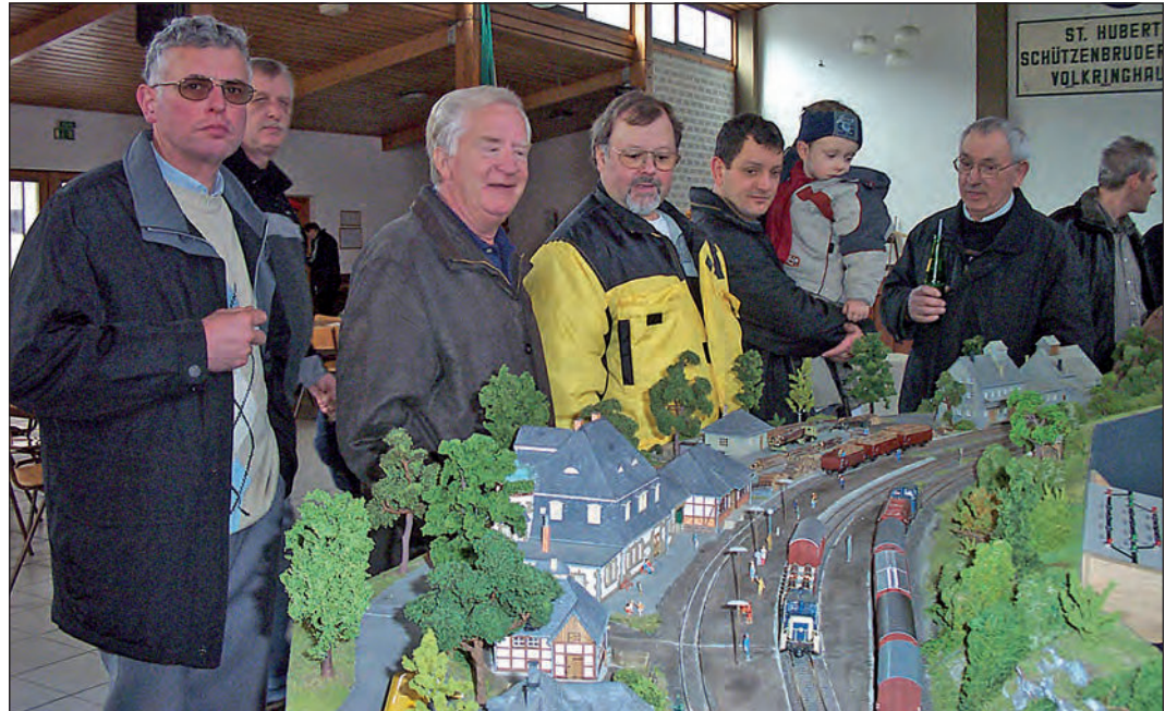
Vom 27. bis 30. Dezember fährt die Hönnetalbahn im Güterschuppen.

Die bis ins Detail liebevoll mit viel Mühe in Eigenarbeit angefertigten Module im Maßstab 1:87 zeigen den Fahrbetrieb auf der Hönnetalbahn in den sechziger Jahren. Es gibt eine faszinierende Fahrzeugvielfalt zu bestaunen, von Dampfzügen über von Dieselloks gezogene Züge bis hin zu den roten