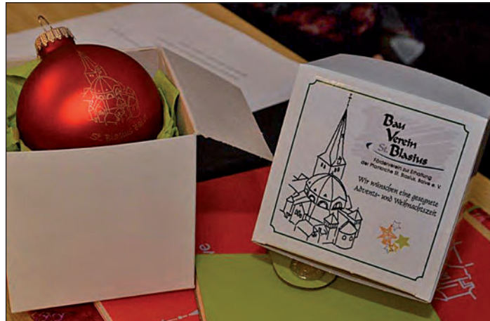
Der Bauverein verkauft am Sonntag Weihnachtskugeln.

Neu in diesem Jahr ist der Verkauf von Weihnachtskugeln mit dem Motiv der Pfarrkirche –