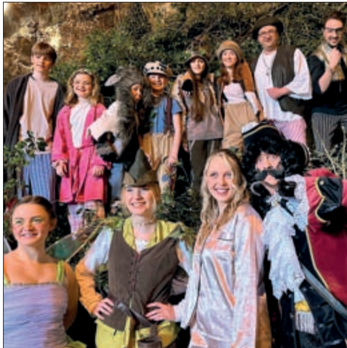
Das Kindermusical Peter Pan wird von den Festspielen zum dritten Mal in der Balver Höhle gespielt.

Das Stück Peter Pan dürfte eigentlich allen bekannt sein, vom Opa bis zum Grundschüler. Wendy und ihre jüngeren Geschwister leben mit ihren Eltern, Mr. und Mrs. Darling, in London. Bei seinem Besuch im Haus verliert Peter Pan seinen Schatten. Er will ihn wie-