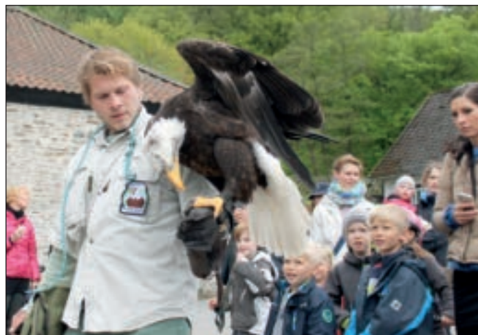
Die Greifvogelschau der Falknerei Pierre Schmidt startet beim Luisenhüttenfest um 14 und 16 Uhr.

Bitte dick im Kalender anstreichen: Luise heizt ein, Samstag, 29. Juni, 17 bis 23 Uhr. Ich darf noch nicht zu viel verraten, aber das diesjährige Motto lautet „Kein Schrott.“ Schrott ist wertvolles Recycling-Material und kann außerdem ganz wunderbar zweckentfremdet werden. Autohupen, Stoßstangen oder Auspuffrohre werden zu witzigen Instrumenten getunt und zwerchfeller-schütternd und virtuos gespielt. Die Besucherinnen und Besucher treffen auf elektrische Roboter aus Verpackungsmüll, sie werden Zeugen eines Mikrodramas im Motorraum. Das liebevoll inszenierte und schillernd präsentierte Event wird zur kleinen Reise durch die Sphären des reanimierten Schrotts.