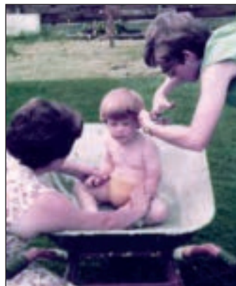
So ging Haare schneiden früher – in der Schubkarre.

an der Balver Hauptstraße im ehemaligen Ladenlokal von Blumen Schepper neu eröffnet hat, auch mit dererlei Langhaarpracht umgehen kann.