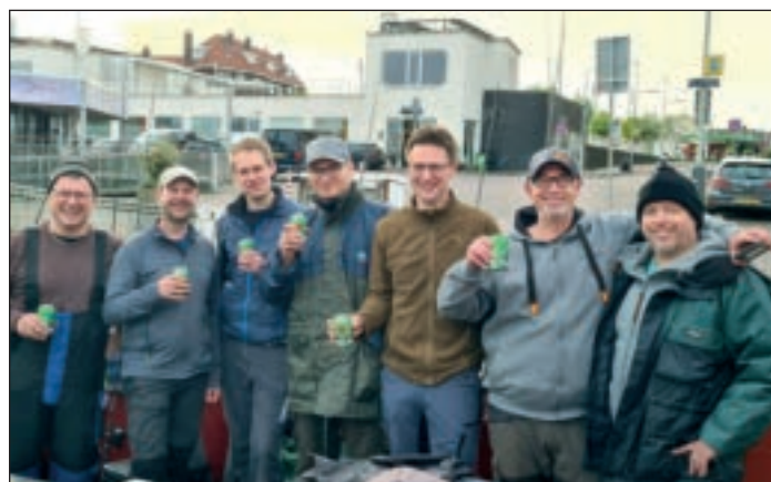
Nichts gefangen, aber trotzdem glücklich. Die Anglerfahrt an die niederländische Nordseeküste machte wieder viel Spaß.

Und dann wird man auch das richtige Gerät an Bord haben, auch wenn auf der Ostsee naturgemäß mit weniger starker Strömung zu rechnen sein dürfte als auf der wilden Nordsee, die sich aber beim Angelausflug der Balver von ihrer ruhigen Seite zeigte.