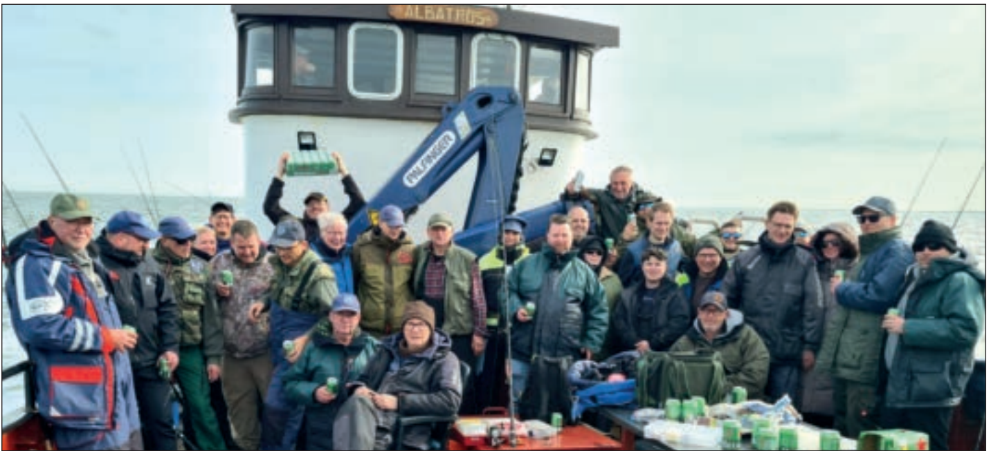
Der Fisch muss schwimmen! In die Kühltaschen der Angler landete jedoch als Ersatz für das Bier nichts.