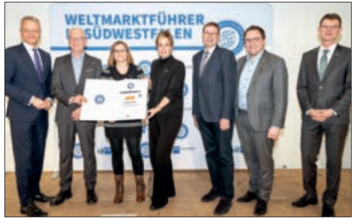
Die beiden in Garbeck ansässigen Firmen Rickmeier (links) und Paul Müller wurden bei einer Veranstaltung der Südwestfälischen Industrie- und Handelskammer als Weltmarktführer ausgezeichnet.

Zwei in Garbeck ansässige Firmen sind Weltmarktführer