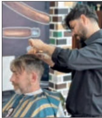
Der Betriebsleiter lässt seine Haare schneiden.