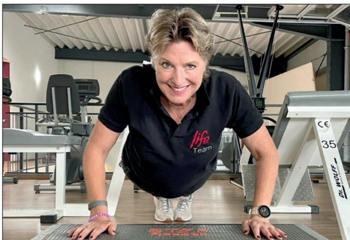
... wie auch heute beim Jubiläum im „life“.

fangreichen Outdoor-Trainingsbereich zu ergänzen.