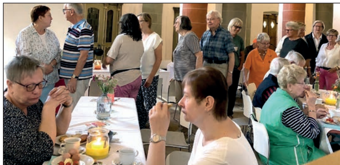
Vor einem Jahr fand das Faire Frühstück in der besonderen Atmosphäre der St.-Blasisu-Pfarrkirche statt.

aus dem näheren Balver Umfeld ergänzen das Frühstücksbuffet.