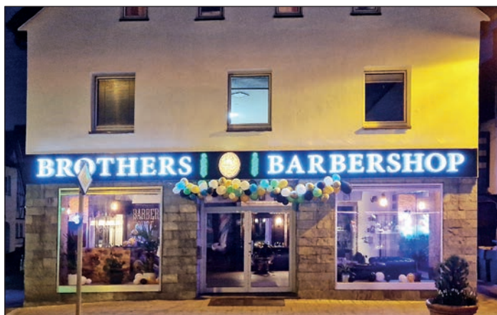
Im Barbershop in Balve wird auf die Hygiene besonders geachtet.

Die Übertragung kann dadurch verhindert werden, dass man das Werkzeug desinfiziert. Außerdem sieht man den Befall bei den betroffenen Kunden recht schnell und kann