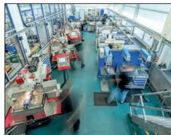
Die Ausbildungswerkstatt der Fa. Rickmeier.

F reitag, den 24. September, findet zum vierten Mal der „Tag der offenen Ausbildung“ in der Ausbildungswerkstatt der Firma Rickmeier von 14.30 Uhr bis 18 Uhr statt.