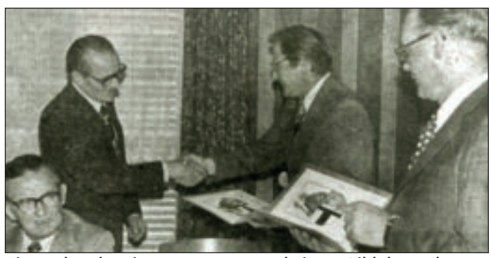
Eine Urkunde mit Amtswappen und einem Bild der stolzesten Leistung, dem Schulzentrum, bekam jedes Amtratsmitglied in der letzten Sitzung.