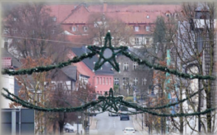
Die Weihnachtsbeleuchtung war in die Jahre gekommen und musste erneuert werden.