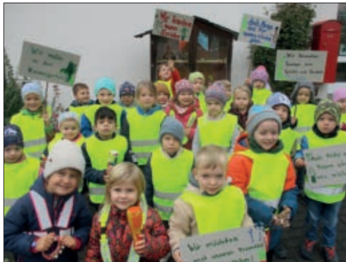
Protest im Katholischen Familienzentrum.

Aber was ist der Hintergrund?! Zu Beginn des Kindergartenjahres 2024/2025 wurden wir vom Träger unseres Kindergartens darüber informiert, dass die derzeitigen finanziellen Zuweisungen des Landes NRW nicht ausreichen, um alle laufenden Kosten der Einrichtung abzudecken. Von Seiten des Landes erfolgt nach dem KiBiz eine finanzielle Basisförderung für Personal- und Sachkosten für jedes in einer Kindertageseinrichtung aufgenommene Kind. Allerdings sind diese Pauschalen vor dem