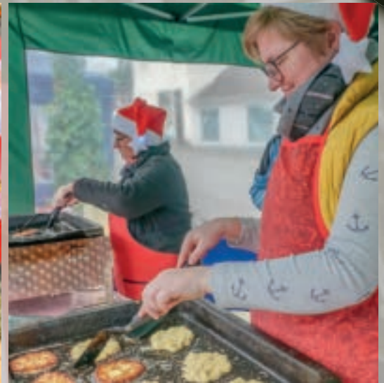
An kalten Dezembertagen beim Weihnachtsmarkt einen Glühwein schlürfen – gibt es etwas schöneres? Dazu dann noch leckere Reibplätzchen – was will man mehr?

etwa 16.30 Uhr. Die weihnachtlichen Stücke laden natürlich zum Mitsingen ein.