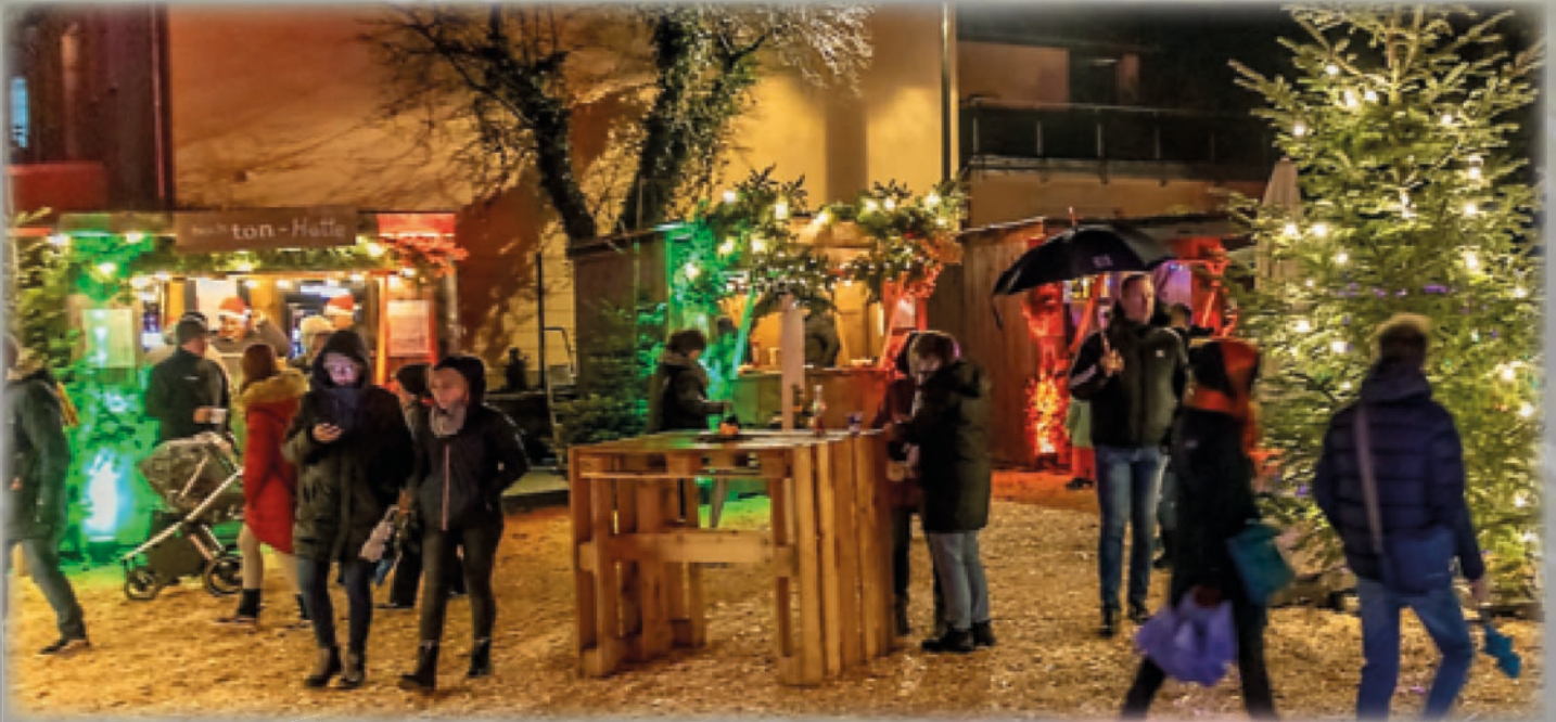
Weihnachtsmarkt auf dem IBS-Parkplatz: Gemütlichkeit wird groß geschrieben.