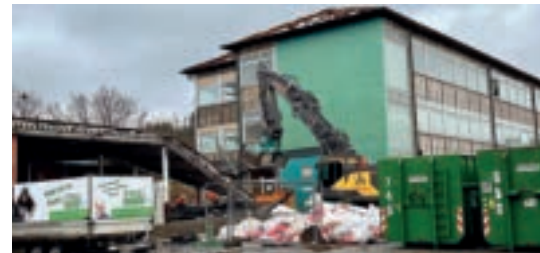
Die ehemalige Hauptschule wird abgerissen um Platz zu schaffen für die „Villa Balve“.

E inen etwas anderen Rückblick auf das Jahr bietet die Redaktion hier ihren Lesern an. Die HÖNNEZEITUNG hat mal das Wichtigste aus den erschienen Print- und Online-Ausgaben herausgefiltert.