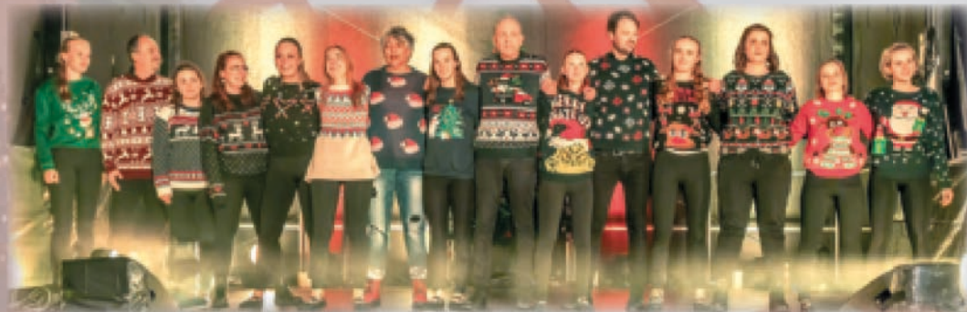
Dem Wandel der Zeit schloss sich auch der Festspielverein an.