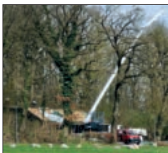
Die SGV-Mitglieder decken das Dach des Vereinsheims neu.