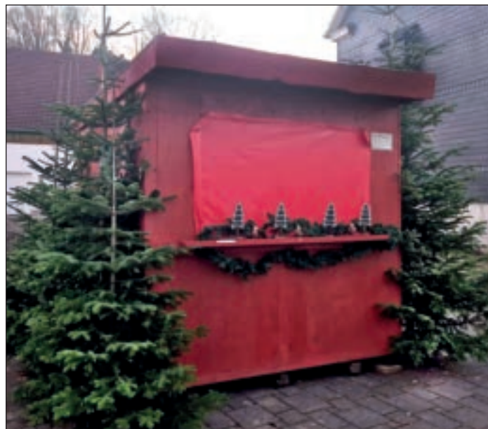
Nur wenn sich ein Nachfolger oder Nachfolgerin für Petra Wick findet, kann die Hütte betrieben werden.

nicht mehr braucht, in der Hütte abgeben kann und sich mitnehmen kann, was er möchte. Es sollte natürlich etwas sein, was für jemand anderen noch einen Zweck erfüllt. Im Übrigen darf auch nehmen, wer nicht gibt und umgekehrt.