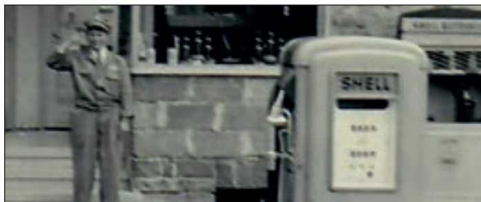
Ein tolles Jubiläum: Seit 70 Jahren gibt es die Shell-Tankstelle.

deckte seine Leidenschaft für Podcasts und in der evangelischen Kirche ging es mit den „Jazzis“ einmal anders zu. Das Trommlerkorps Eisborn verschlug es ins ferne Amerika und die „Villa Balve“ kündigte nun ihren Bau für kommenden Januar an.